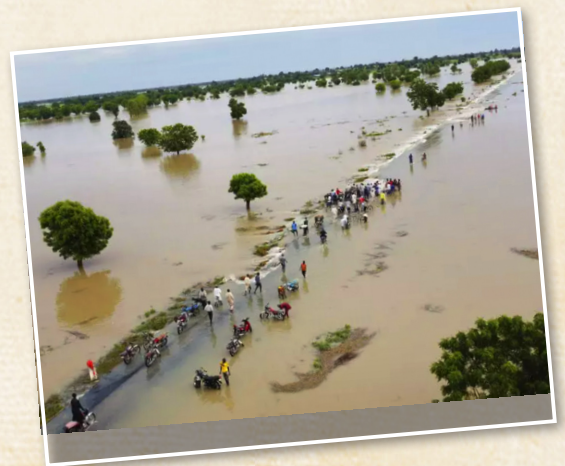
People walking through river floodwaters after heavy rainfall in Hadeja, Nigeria.

https://www.youtube.com/watch?v=bl4hcyUZeUo